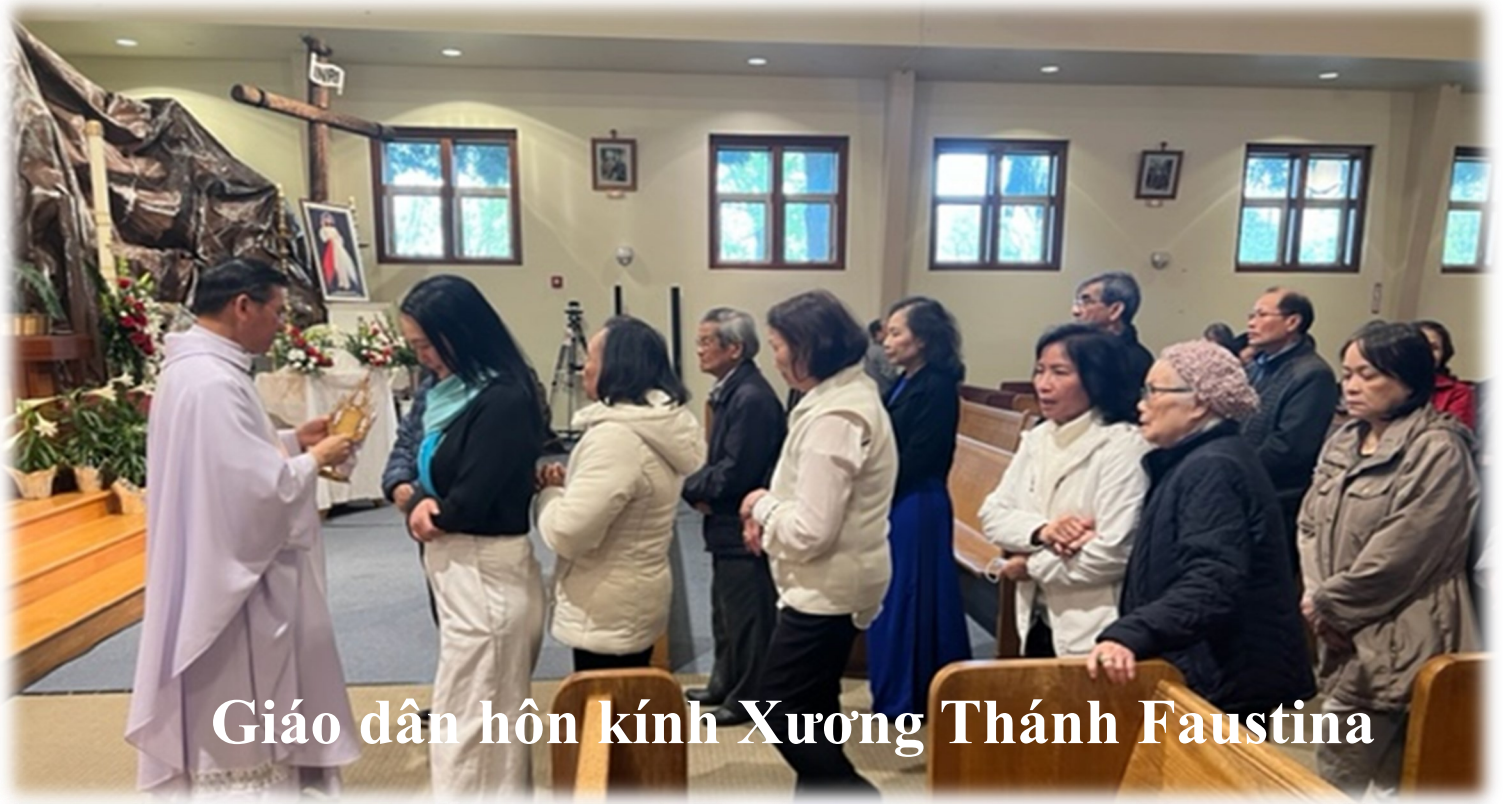
Giáo dân hôn kính Xương Thánh Faustina