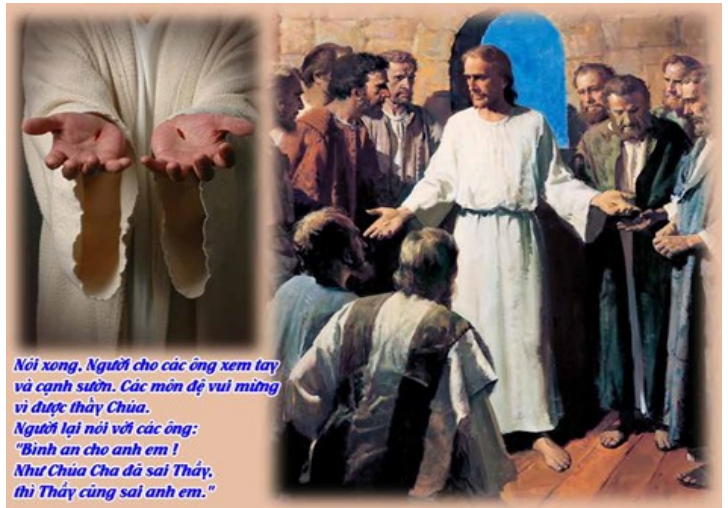
Nói xong. Người cho các ông xem tay và cạnh sườn. Các môn đệ vui mừng vì được thấy Chúa. Người lại nói với các ông: "Bình an cho anh em! Như Chúa Cha đã sai Thầy, thì Thầy cũng sai anh em."