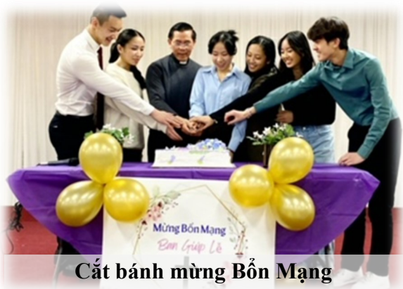
Cắt bánh mừng Bốn Mạng