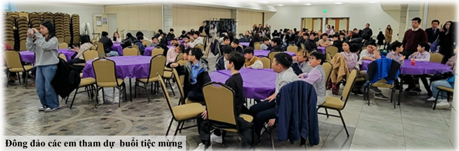
Đồng đạo các em tham dự buổi tiệc mừng