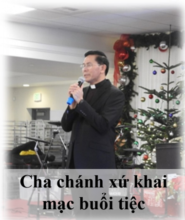
Cha chánh xứ khai mạc buổi tiệc