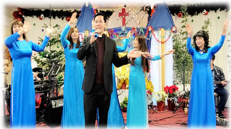
Buổi tiệc mừng với chương trình văn nghệ khá vui nhộn